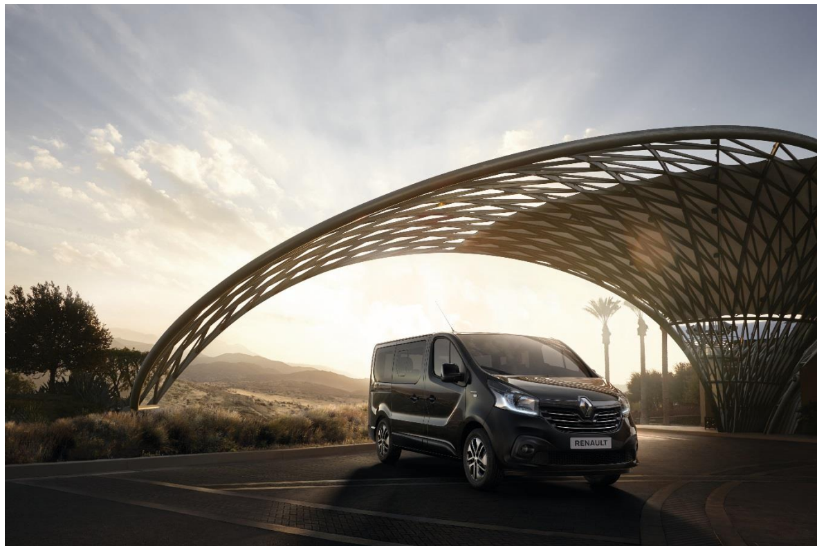
Trafic SpaceClass © Renault